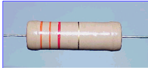
Figura 1.8: Aspecto de un resistor

Los dos primeros colores representan números, mientras que el tercer color indica la cantidad de ceros. Ver tabla.