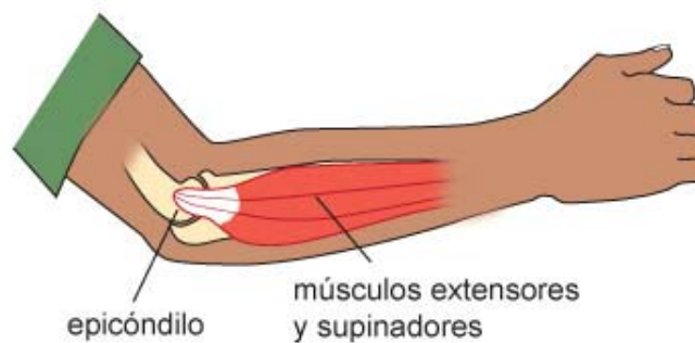
Fig. Anatomía del codo

La Epicondilitis o “codo de tenista” es una lesión por esfuerzo repetitivo en el movimiento de pronación-supinación forzada, en la que se inflaman los tendones de los músculos de la cara externa del codo (los músculos extensores de los dedos y la muñeca, y los supinadores del antebrazo) con un origen común (unión) en el Epicóndilo.