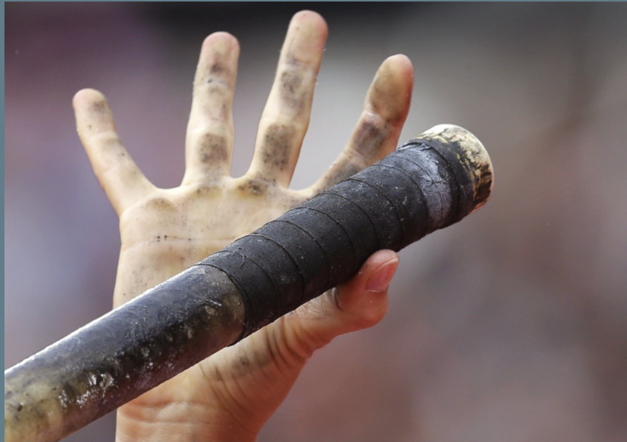
PD PLANO DETALLE