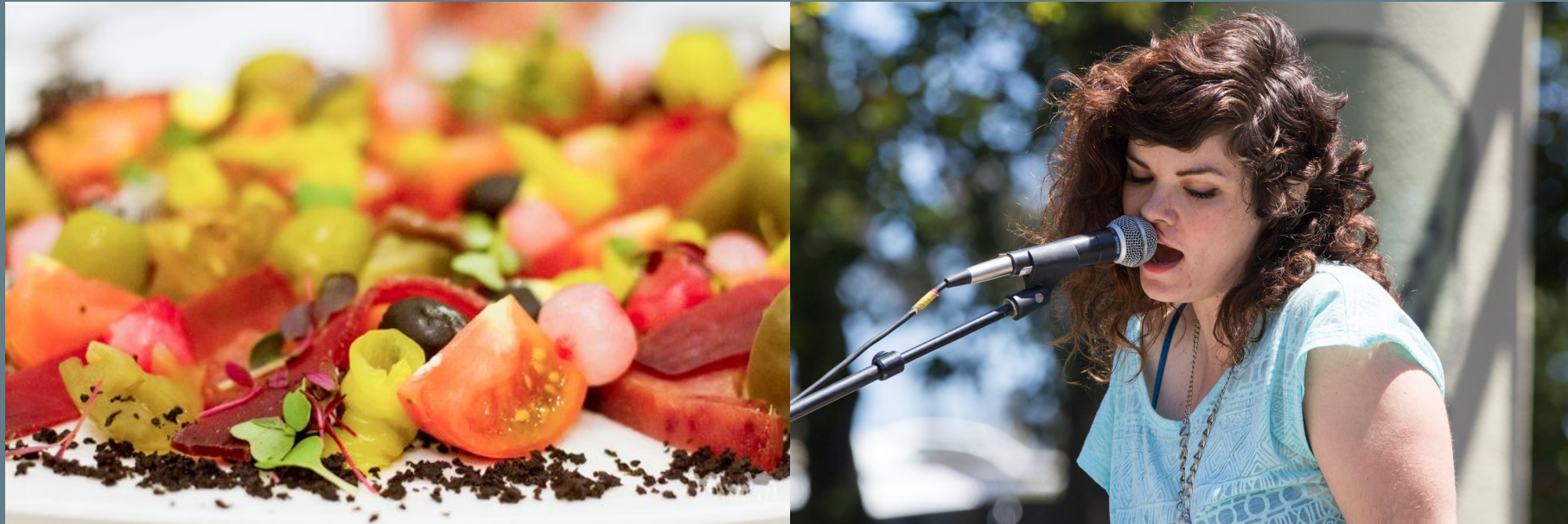
Figura y Fondo