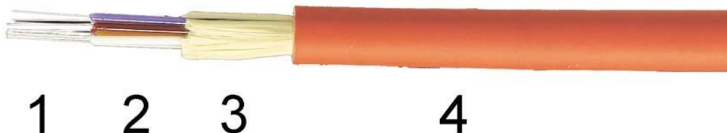
Figura 4: Cable CDI de OPTRAL (DIN J-K(ZN)H12G...)