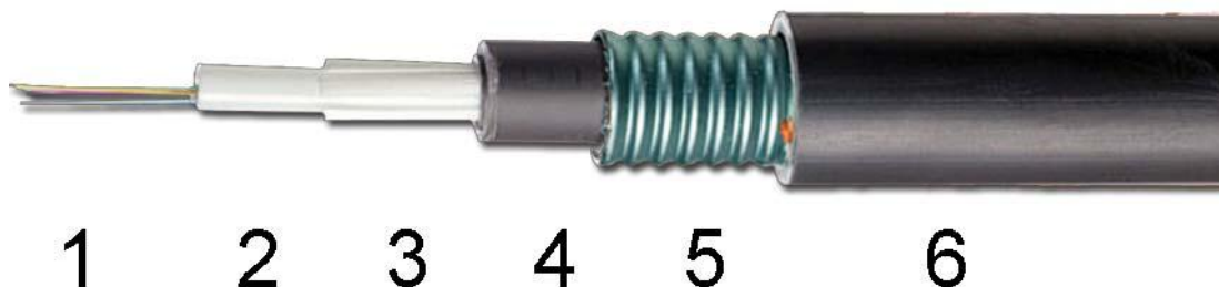
Figura 3: Cable DPESP-1 de OPTRAL

Así, un cable tipo PES-P 8 x SM sería un cable estanco con doble relleno, estructura holgada, con doble cubierta de PE y armadura de acero, de 8 fibras ópticas SM